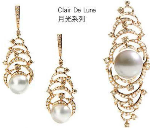
Clair De Lune 月光系列